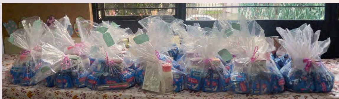
40 kits distribuídos